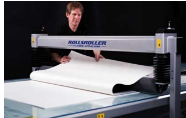
4. Vik hälften av dekoren över valsens.