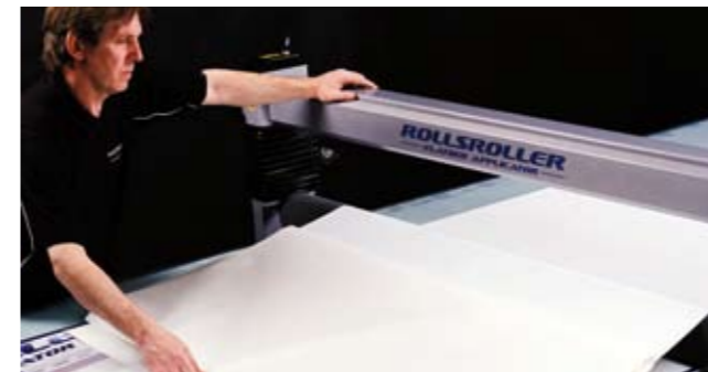
9. Applicera andra halvan av dekoren med hjälp av trycksatt vals.