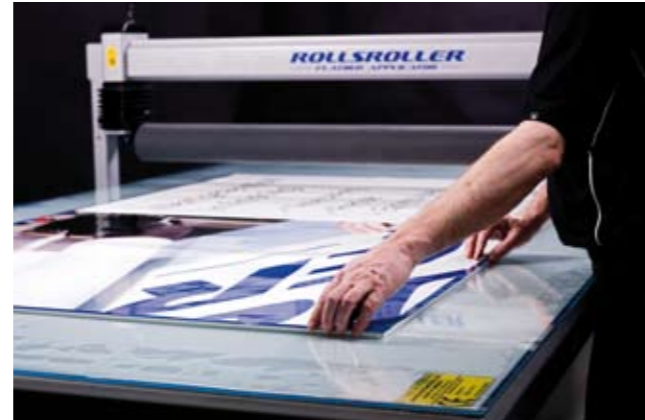
2. Placera dekoren på underlaget.