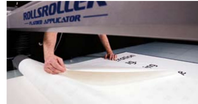
5. Dra av linern.