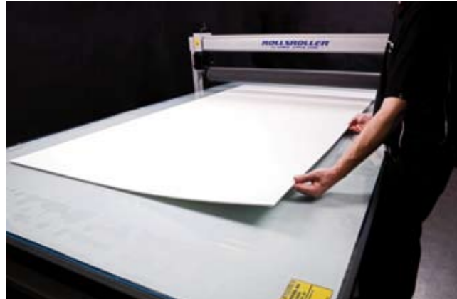
1. Placera skyltmaterialet centrerat på bordet.

Vi väljer att visa steg-för-steg hur enkelt det är, för en ensam operatör, att montera dekor med hjälp av ROLLSROLLER®. På www.rollroller.se hittar du filmer där du kan se hur andra typer av appliceringar går till.