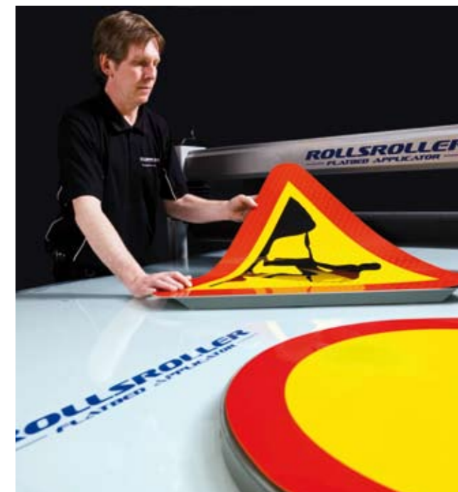
ROLLSROLLER® används till alla typer av självhäftande folie. Till exempel trafikskyltar.

På www.rollssroller.se hittar du uttalanden från några som redan har investerat i en ROLLSROLLER®.