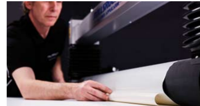
7. Vik in linern under valsens.