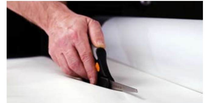
6. Klipp av linern.