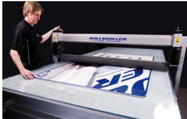
3. Trycksätt valsens för att fixera.