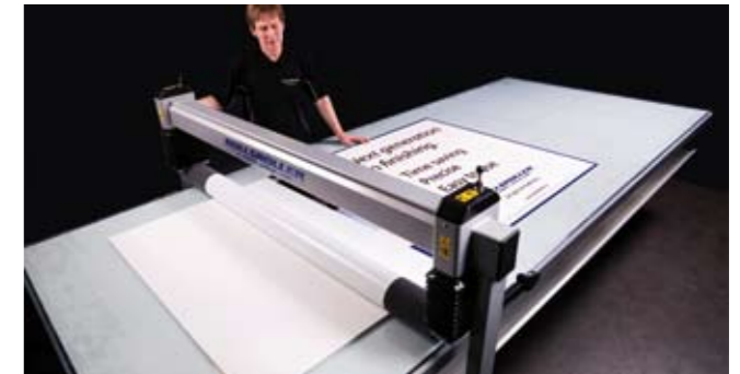
8. Applicera hälften av dekoren med hjälp av valsens.