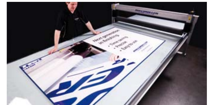
10. Och du har en skylt helt utan veck och bubblor.